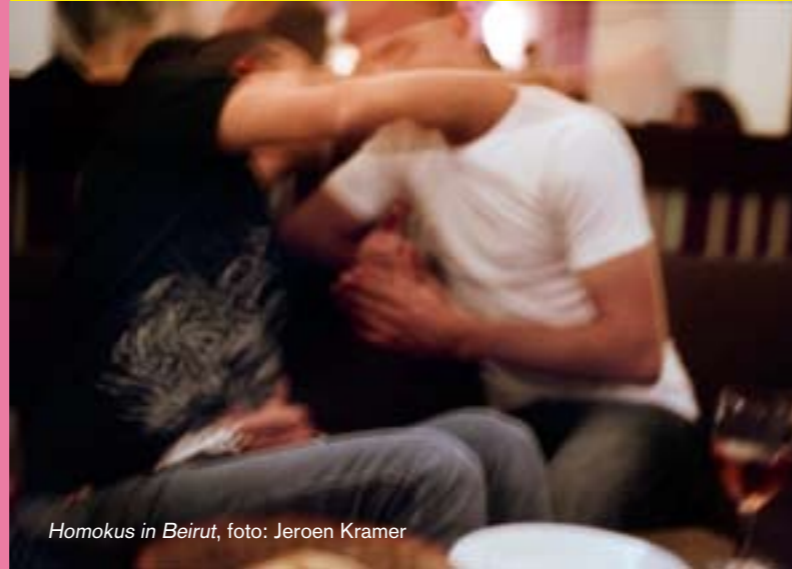
Homokus in Beirut