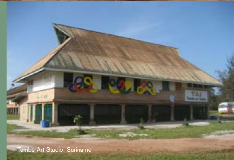
Tembe Art Studio, Suriname