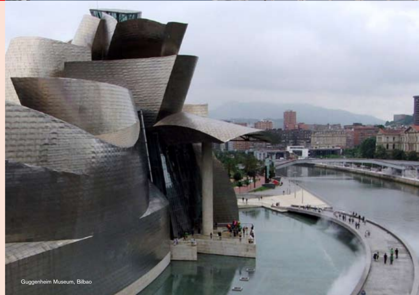
Guggenheim Museum, Bilbao