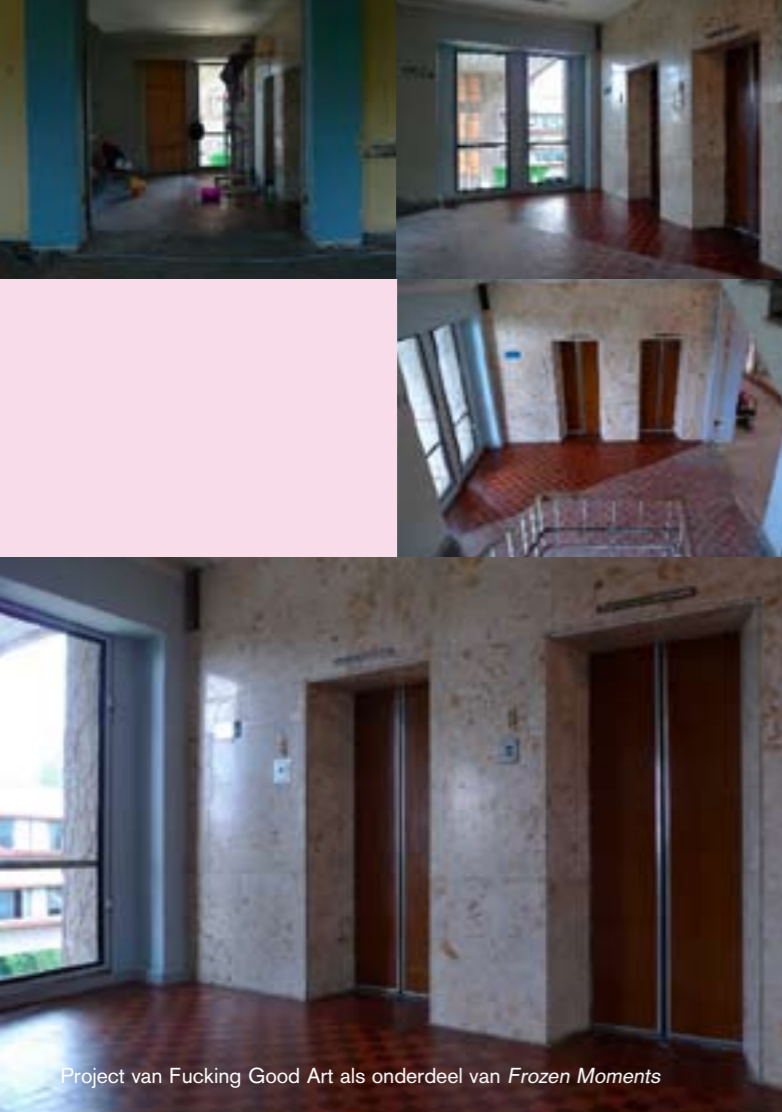
Project van Fucking Good Art als onderdeel van Frozen Moments