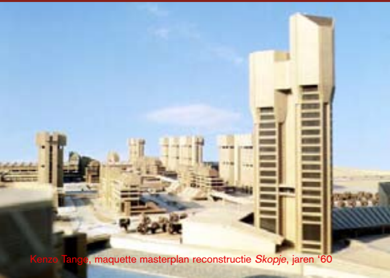
Kenzo Tange, maquette masterplan reconstructie Skopje, jaren '60