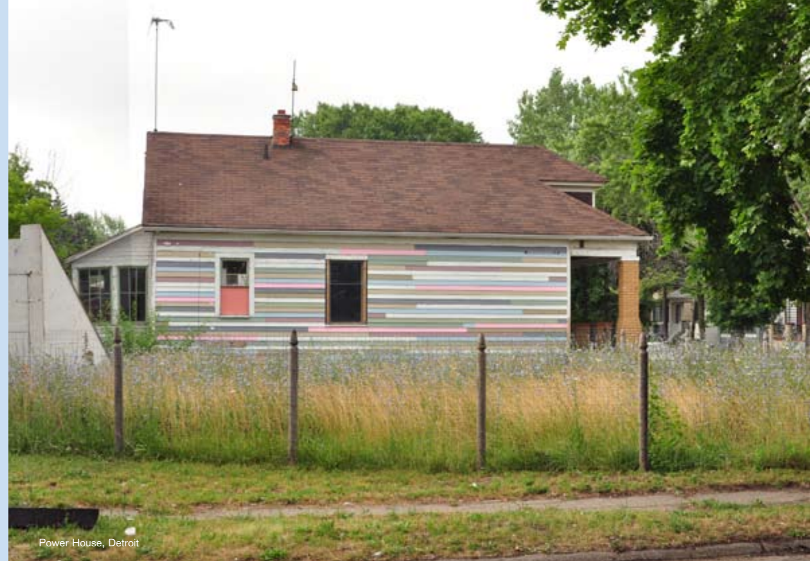
Power House, Detroit