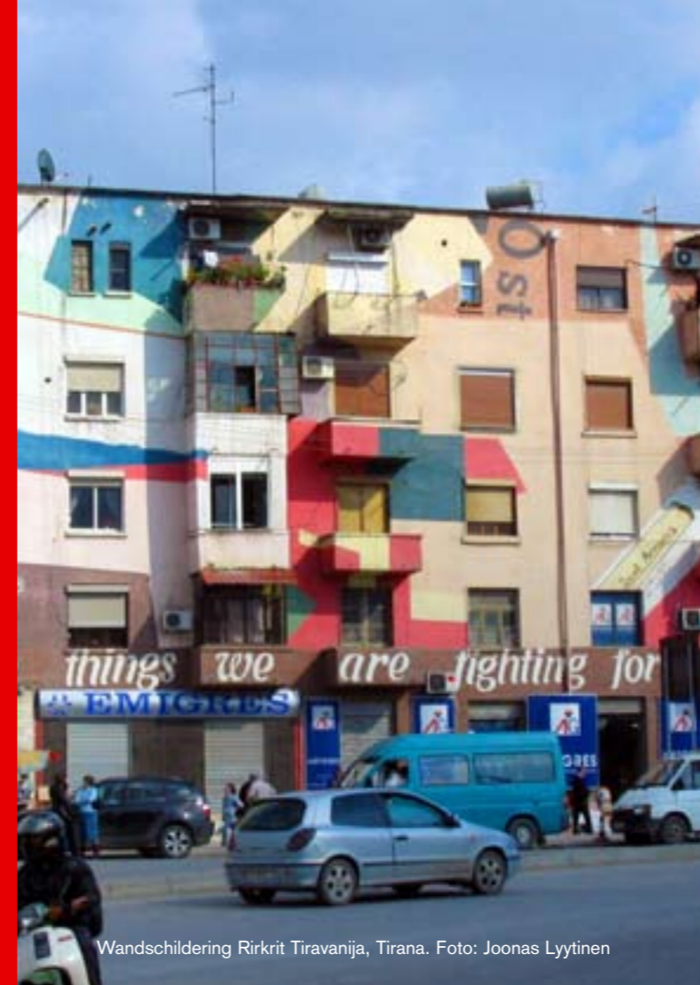
Wandschildering Rirkrit Tiravanija, Tirana.