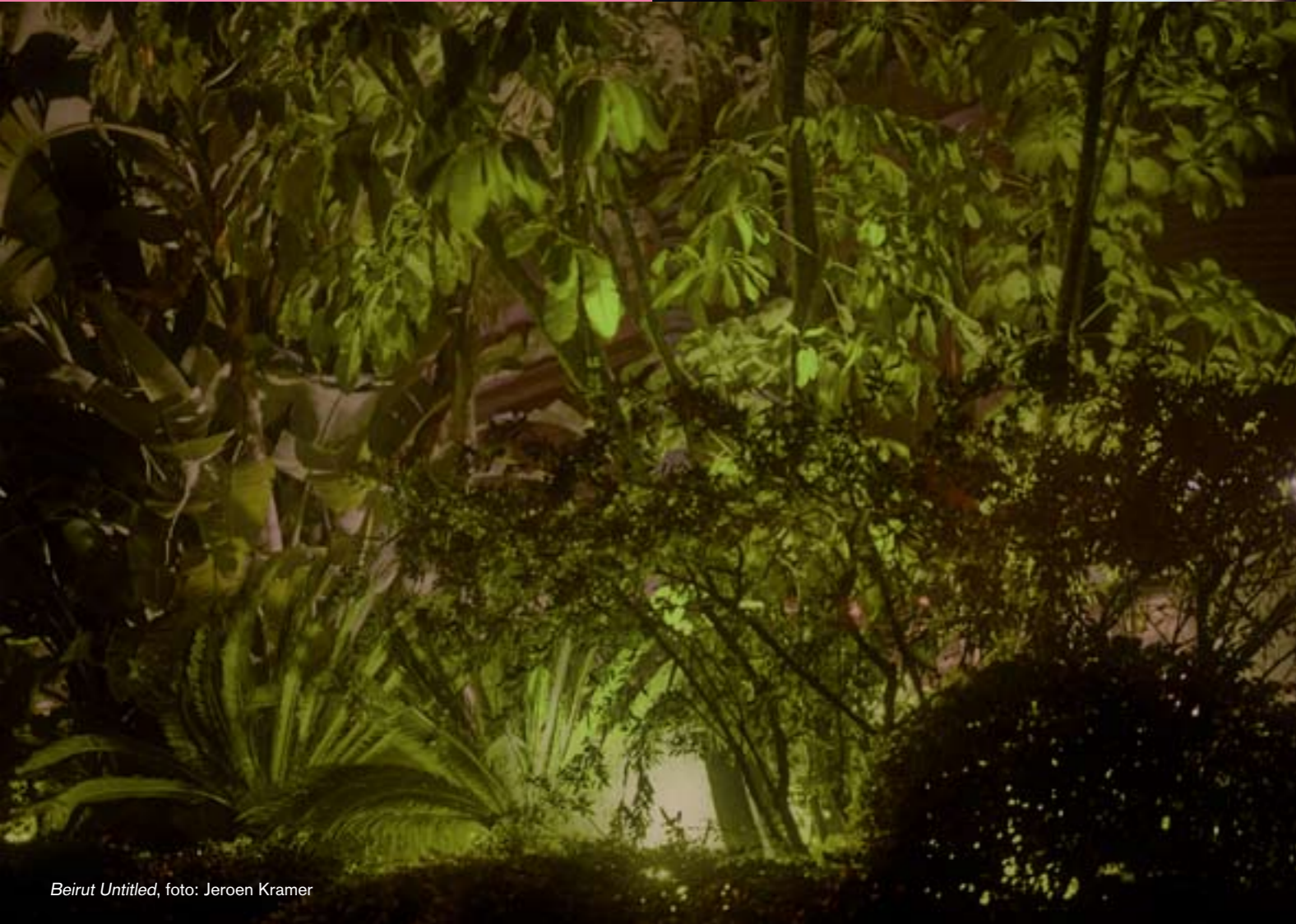
Beirut Untitled

“Al met al ligt er aanzienlijk wat op het bord van Annelies Kuiper: geen schijf van vijf, maar een schijf van zeven waarbinnen zij voedzame en aantrekkelijke combinaties moet maken. Zij is aanspreekpunt, aanjager, motor, breekijzer, bemiddelaar en – hopelijk maar heel af en toe – pispaal.” Dit stond in een artikel van Merel Bem in Nieuwsbrief 016 over de zeven speerpunten van het programma van de intendant documentaire fotografie.