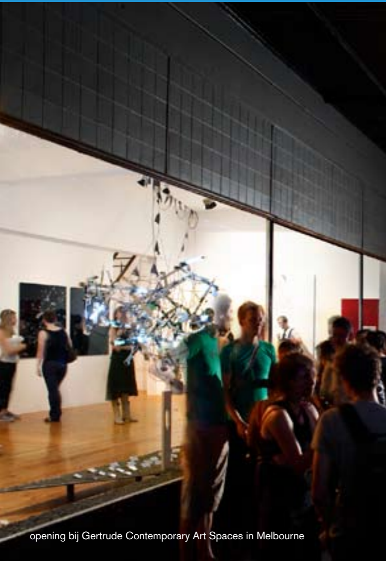
opening bij Gertrude Contemporary Art Spaces in Melbourne