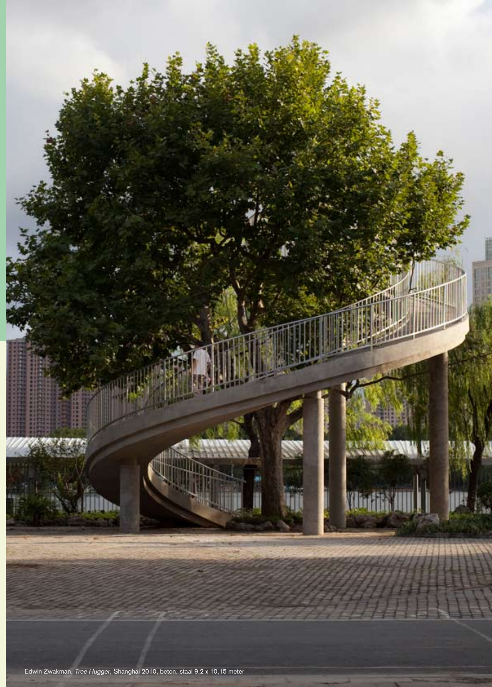
Edwin Zwakman, Tree Hugger , Shanghai 2010, beton, staal 9,2 x 10,15 meter